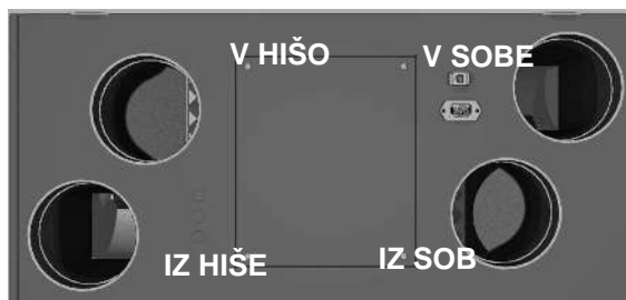
Izvedba DESNO - R