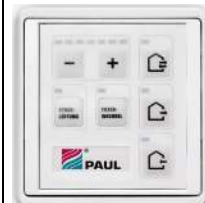
LED-Regulacija (ŠxVxG v mm: 80x80x12)