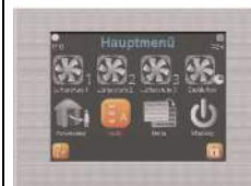
TFT-ekran na dotik (touchpanel) barvni (BxHxT in mm: 102x78x14)