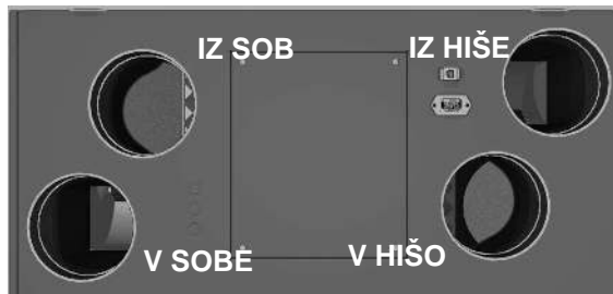
Izvedba LEVO - L